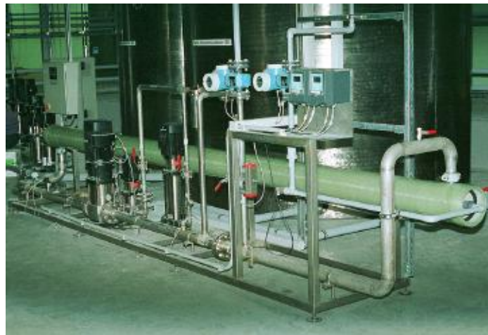
Nanofiltration, Envopur® NFI