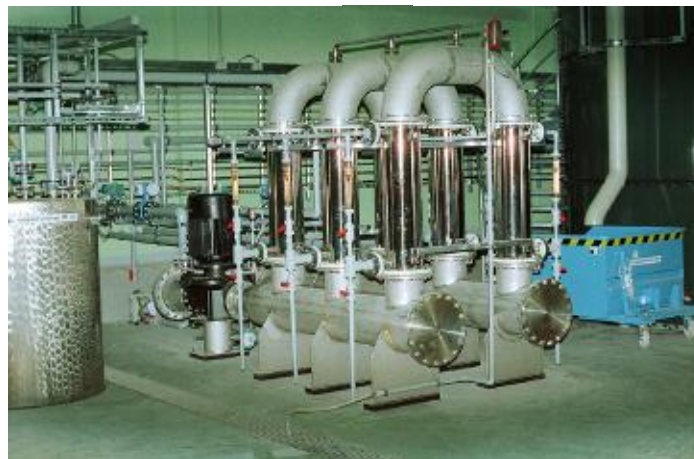
Mikrofiltration, Envopur® MFI

MEWA Industrie-Textilien GmbH Groß Kienitz, Germany